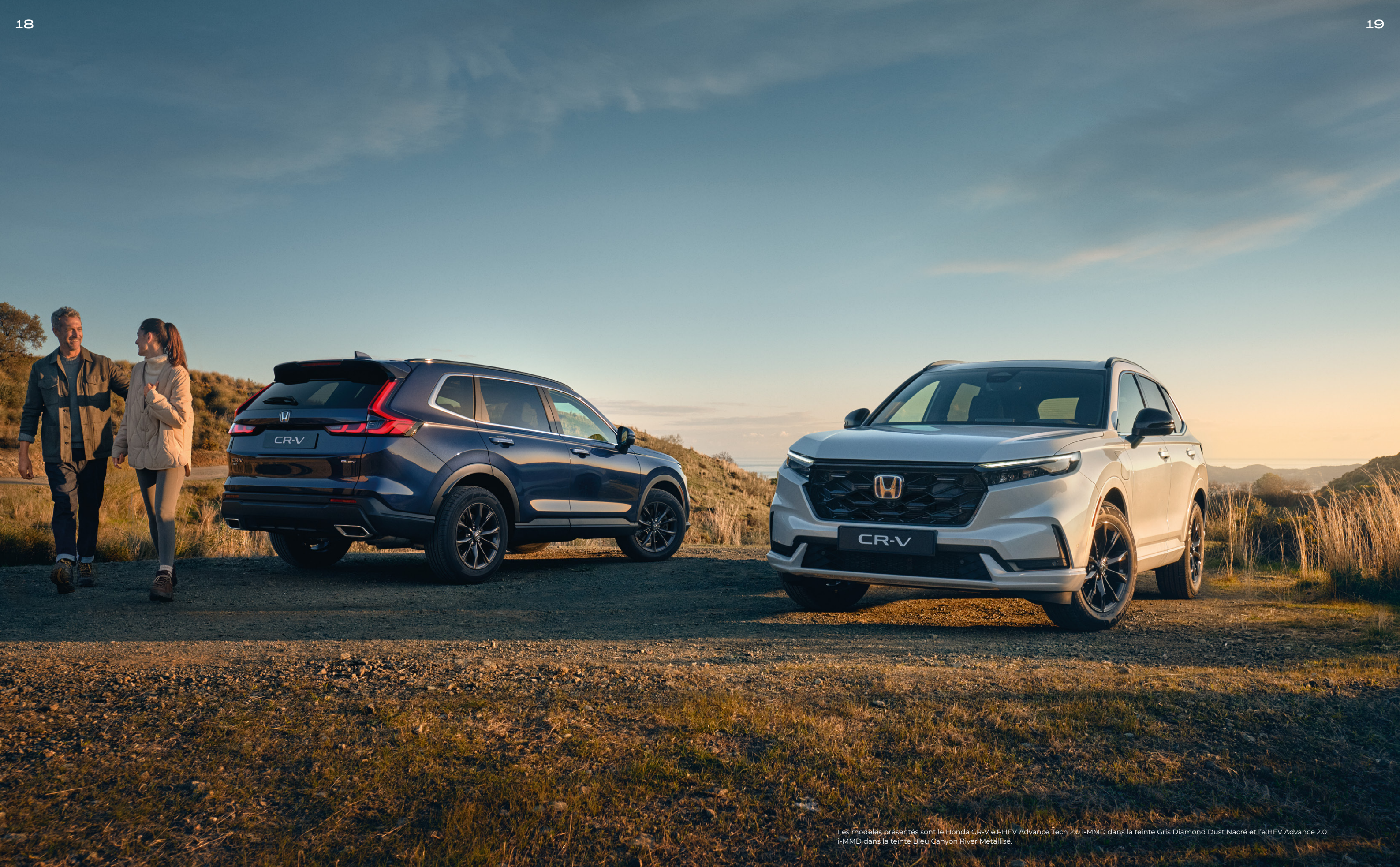
Les modèles présentés sont le Honda CR-V e:PHEV Advance Tech 2.0 i-MMD dans la teinte Gris Diamond Dust Nacré et l'e:HEV Advance 2.0 i-MMD dans la teinte Bleu Canyon River Métallisé.