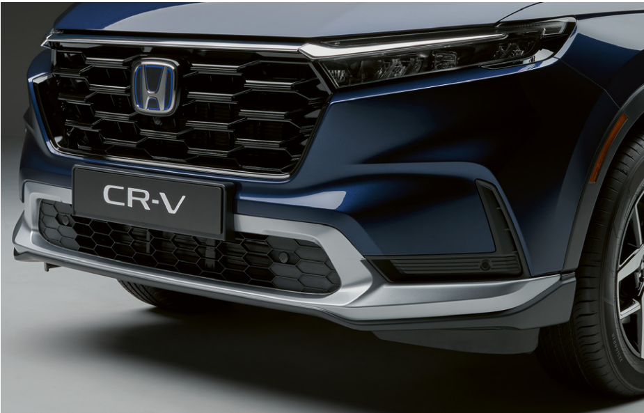
PARE-CHOCS AVANT AÉRODYNAMIQUE Optimisez la dynamique et le style premium de votre CR-V avec ce pare-chocs avant aérodynamique distinctif.