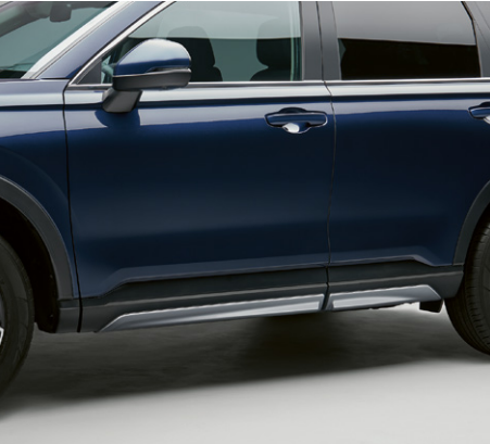
JUPES LATÉRALES Conférez à votre véhicule un profil excitant et sportif avec ces jupes latérales élégantes et raffinées.