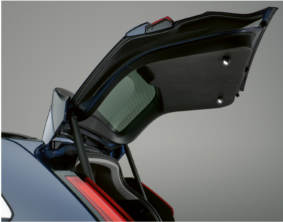
ÉCLAIRAGE DE HAYON L'éclairage de hayon est conçu pour rehausser votre confort et votre sécurité, en éclairant non seulement le coffre mais aussi la zone à l'arrière votre voiture. Les LED à l'intérieur du hayon assurent un éclairage puissant et homogène du coffre, même lorsqu'il est plein.