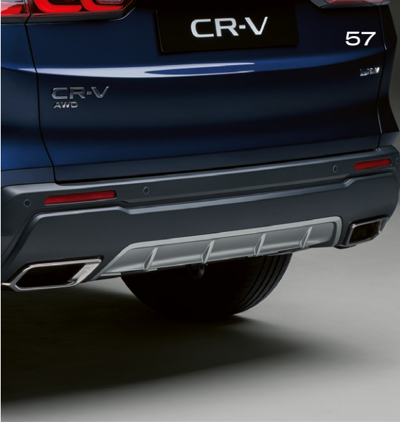
PARE-CHOCS ARRIÈRE ABAISSÉ Ce pare-chocs arrière abaissé complète parfaitement le pare-chocs avant aérodynamique et les jupes latérales, accentuant ainsi l'allure sportive.