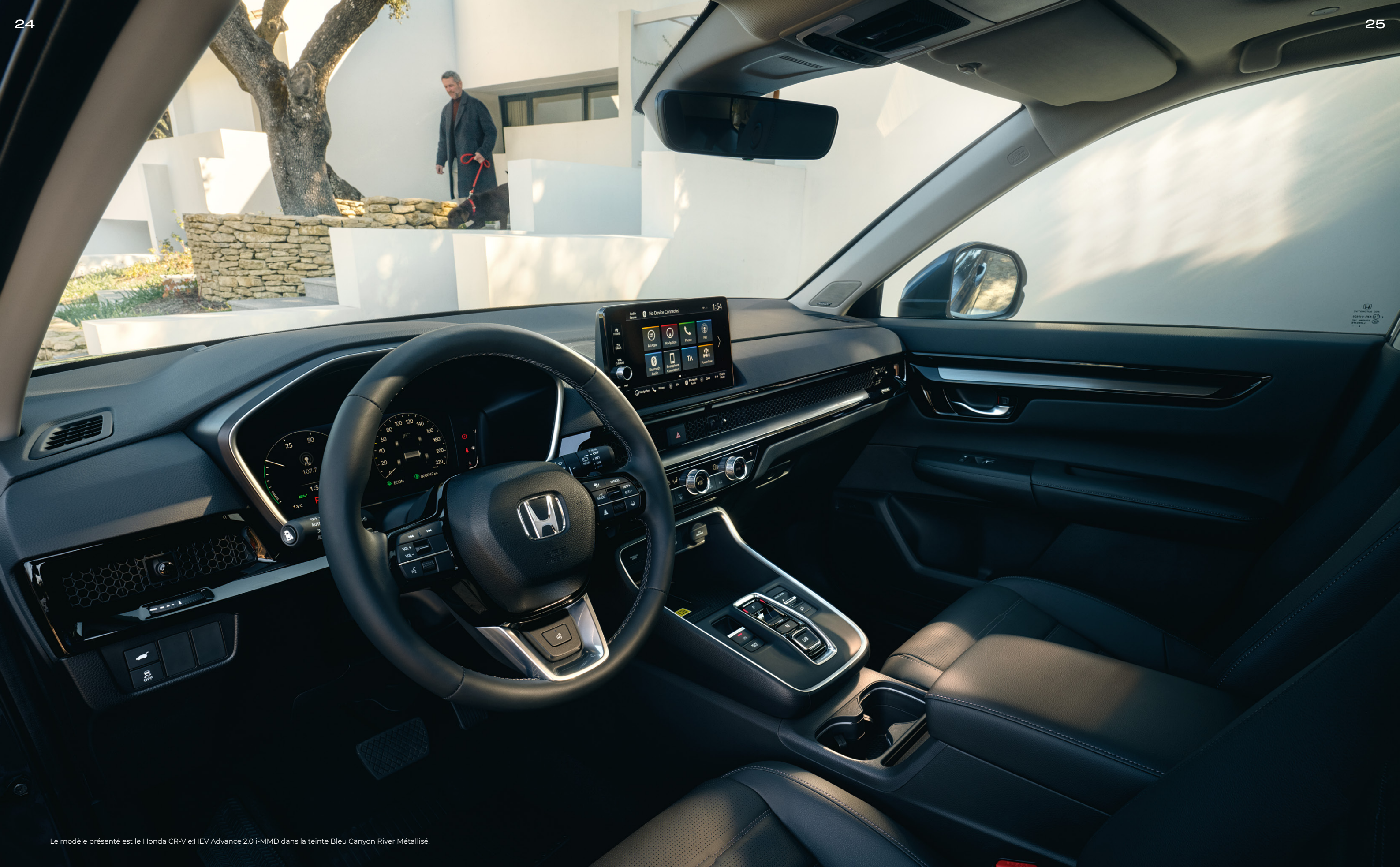
Le modèle présenté est le Honda CR-V e:HEV Advance 2.0 i-MMD dans la teinte Bleu Canyon River Métallisé.