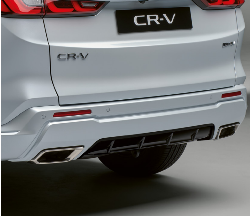
PARE-CHOCS ARRIÈRE ABAISSÉ Parachevez l'allure de votre CR-V avec ce pare-chocs arrière abaissé dans une combinaison de couleur Noir Berlina associée à celle de la carrosserie. Il est parfaitement assorti au pare-chocs aérodynamique avant et aux jupes latérales.

Le pack comprend : un pare-chocs avant aérodynamique, un pare-chocs arrière abaissé, un spoiler de hayon Noir Berlina et des jupes latérales Noir Berlina.