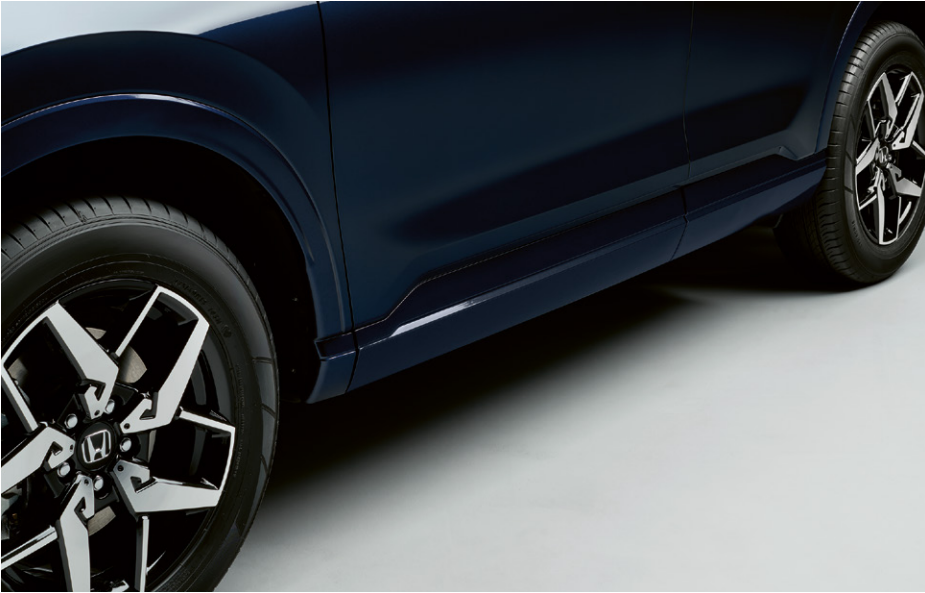
GARNITURES DE BAS DE PORTE Conférez à votre véhicule un profil attrayant et sportif avec ces garnitures de bas de porte.