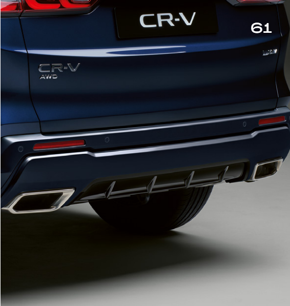
PARE-CHOCS ARRIÈRE ABAISSÉ Parachevez l'allure de votre CR-V avec ce pare-chocs arrière abaissé dans une combinaison de couleur Noir Berlina associée à celle de la carrosserie. Il est parfaitement assorti au pare-chocs aérodynamique avant et aux garnitures de passage de roue.