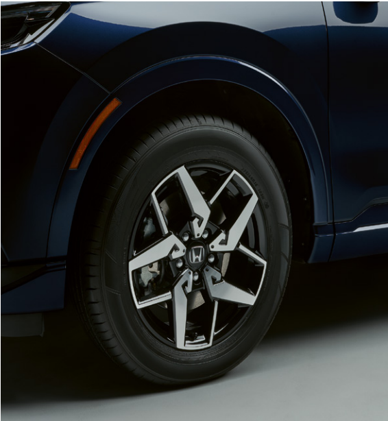
GARNITURES DE PASSAGE DE ROUE Ces garnitures de passage de roue peintes transforment complètement l'aspect de votre voiture, lui conférant un look encore plus stylé. Elles sont assorties aux autres éléments du Pack Style.