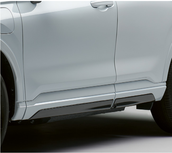
JUPES LATÉRALES Conférez à votre véhicule un profil excitant et sportif en ajoutant ces jupes latérales.