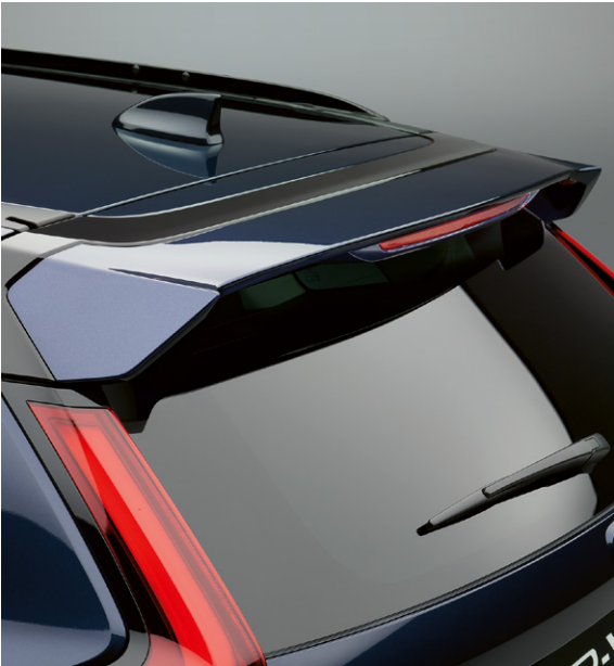
SPOILER DE HAYON Le spoiler de hayon de la teinte de la carrosserie complète les lignes du toit et accentue le caractère sportif.