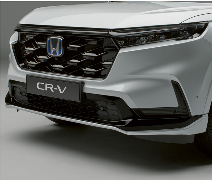
PARE-CHOCS AVANT AÉRODYNAMIQUE Renforcez l'allure dynamique de votre véhicule grâce au pare-chocs avant aérodynamique. La combinaison de la teinte de la carrosserie et du noir Berlina confère une touche haut de gamme à la zone du pare-chocs.