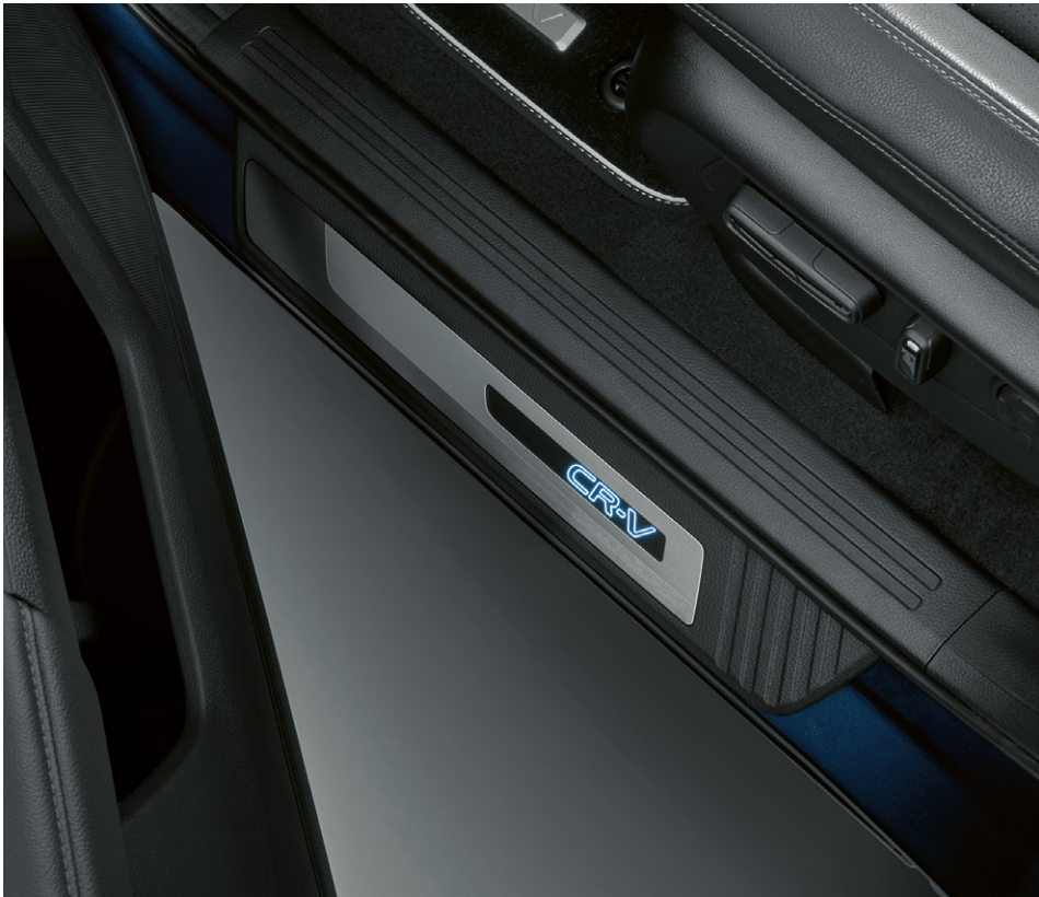
GARNITURES DE SEUIL DE PORTE ILLUMINÉES Ajoutez une touche de style supplémentaire à l'intérieur de votre CR-V grâce aux garnitures de seuil de porte illuminées. La finition en acier inoxydable avec logo CR-V s'illumine pour un éclairage élégant lorsque vous ouvrez la porte.