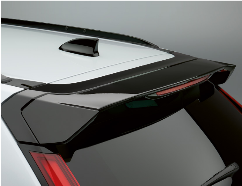
SPOILER DE HAYON Ajoutez une touche de sportivité à votre CR-V grâce au spoiler de hayon, qui complète les lignes du toit et de l'arrière du véhicule.