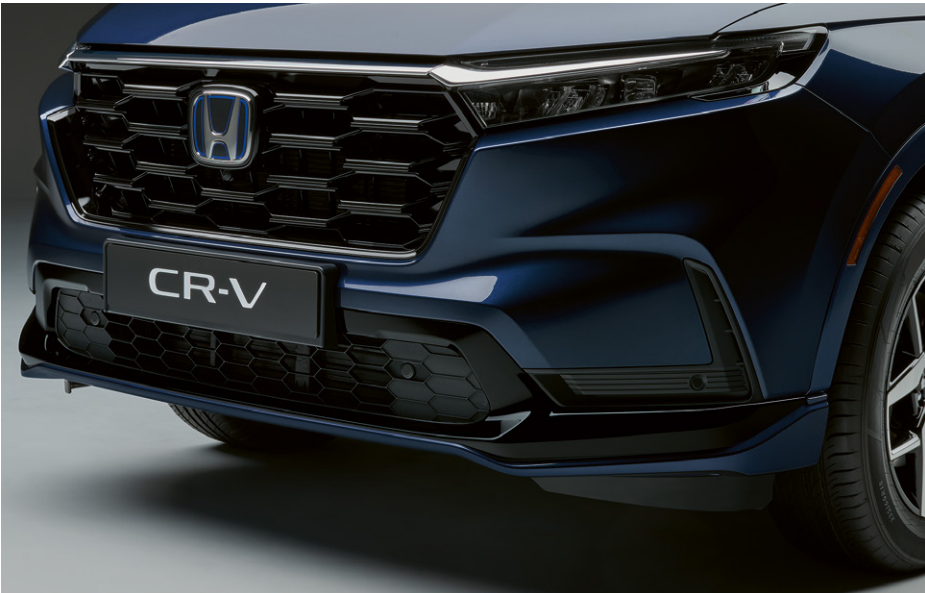
PARE-CHOC AVANT AÉRODYNAMIQUE Renforcez l'allure dynamique de votre véhicule grâce au pare-chocs avant aérodynamique. La combinaison de la teinte de la carrosserie et du noir Berlina confère une touche haut de gamme à la zone du pare-chocs.