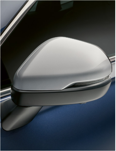
COQUES DE RÉTROVISEURS EXTÉRIEURS Ajoutez une touche personnelle avec ces coques de rétroviseurs intelligents conçues pour s'intégrer en toute transparence dans votre CR-V.