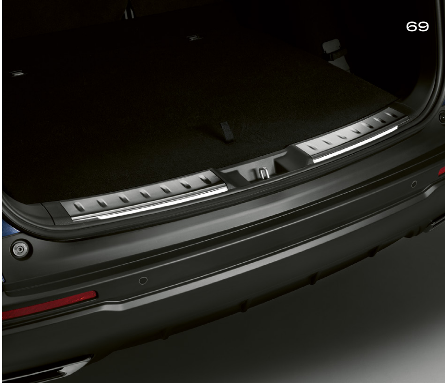
DÉCORATIONS DE SEUIL DE CHARGEMENT ILLUMINÉES Protégez le seuil de coffre en installant cette garniture de seuil de coffre en acier inoxydable. Elle s'allume lors de l'ouverture du couvercle du coffre pour améliorer la visibilité de nuit.