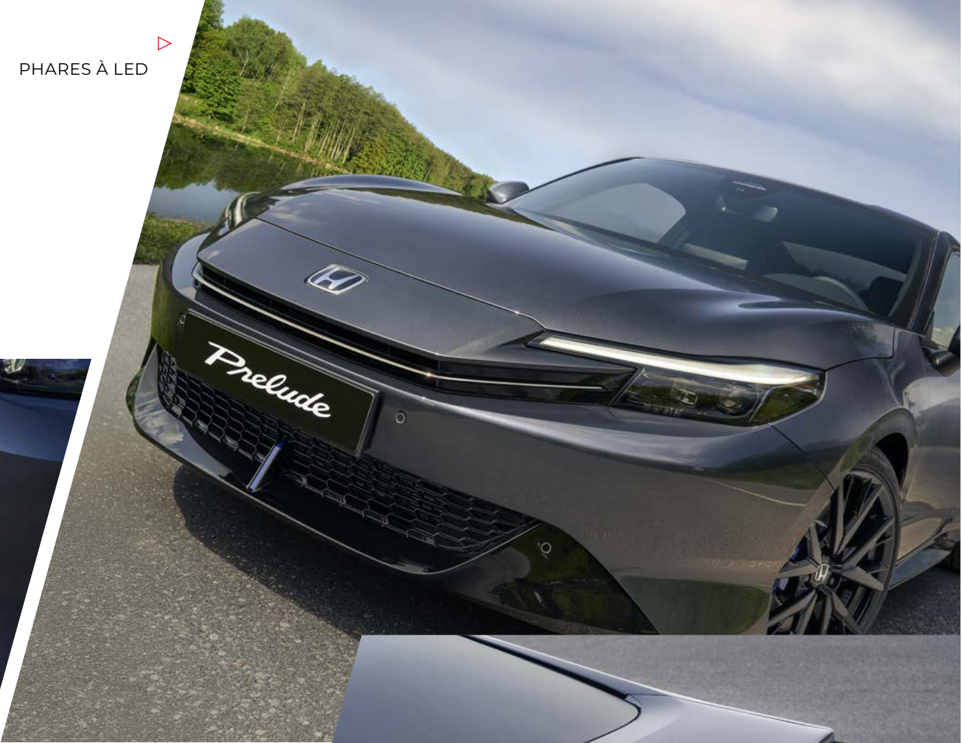
PHARES À LED