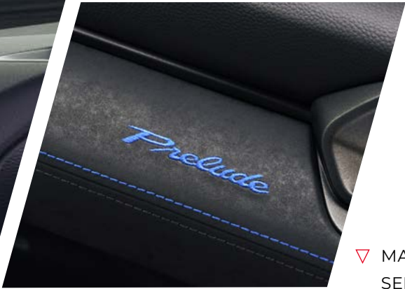
MATÉRIAUX DOUX AU TOUCHER SELLERIE CUIR À L'AVANT