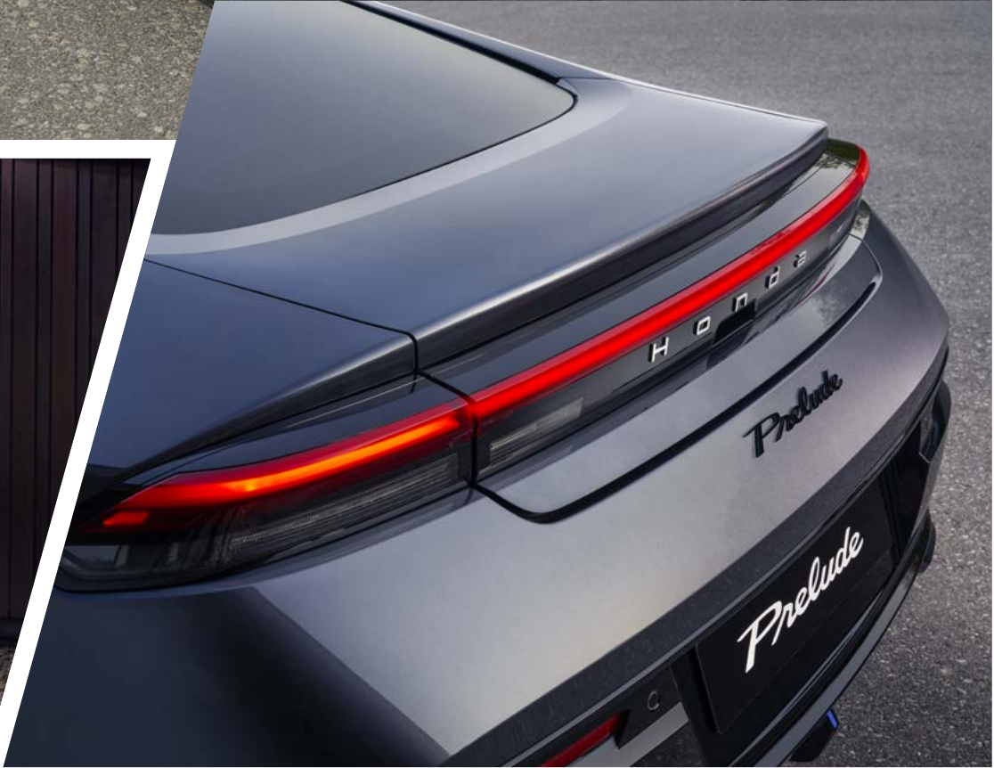
PROFIL FASTBACK ÉPURÉ