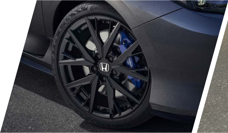
JANTES EN ALLIAGE 19"