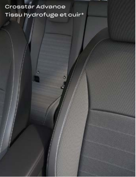
Crosstar Advance Tissu hydrofuge et cuir*