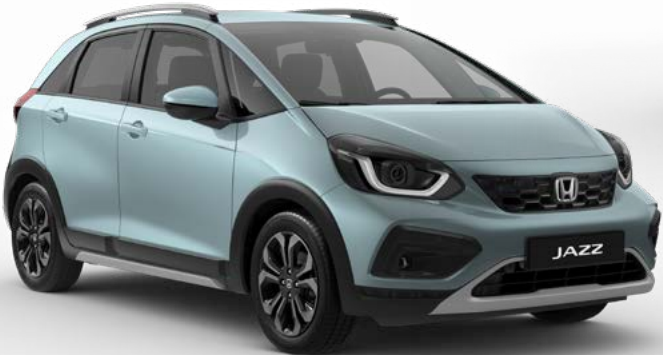
Fjord Mist Pearl