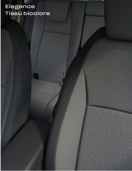
Elegance Tissu bicolore