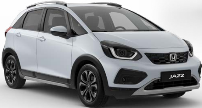
Blanc Premium sunlight