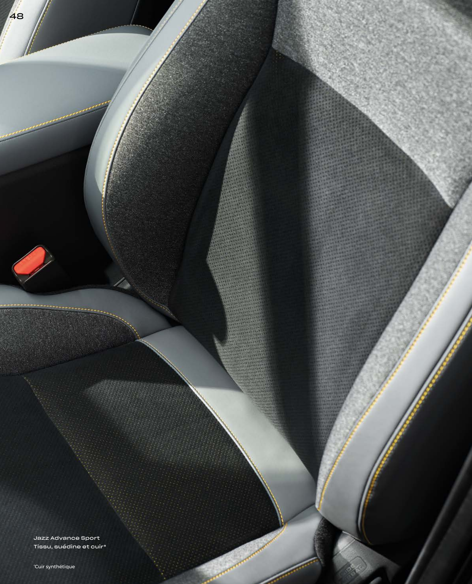
Jazz Advance Sport Tissu, suédine et cuir*