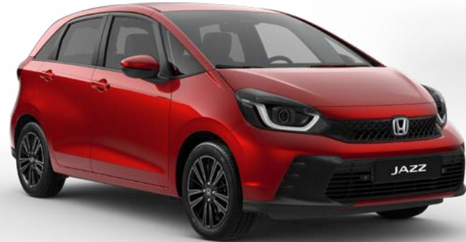
Rouge Premium Crystal