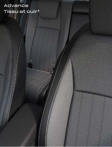
Advance Tissu et cuir*